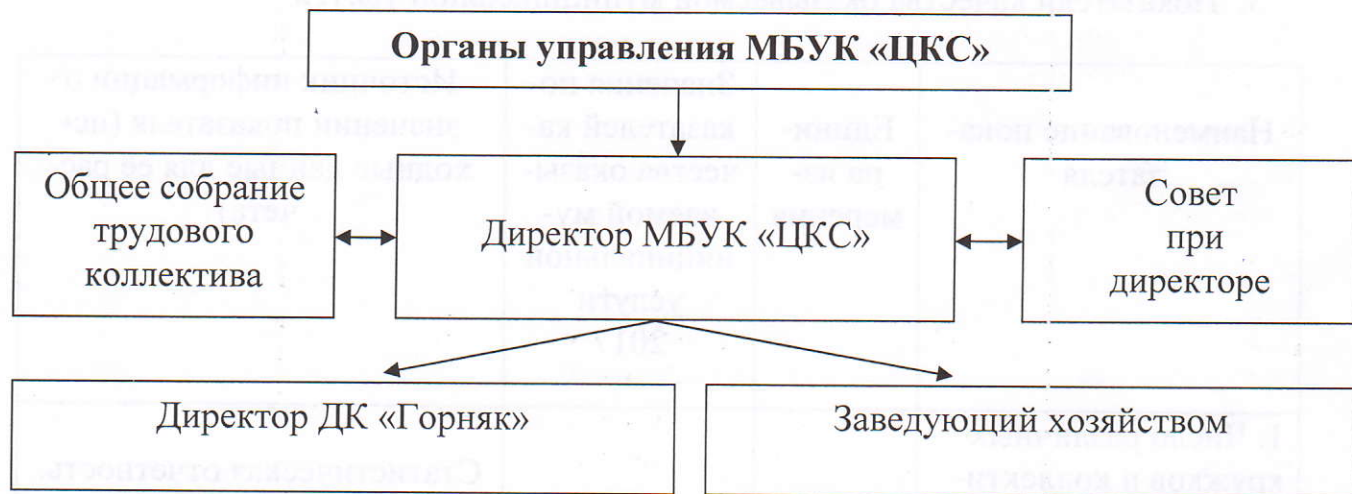
Рисунок 1. Схема структуры управления учреждения, его органов самоуправления и связи иерархической подчиненностью

3.2. Органами управления МБУК «ЦКС» являются руководитель МБУК «ЦКС», а также иные предусмотренные федеральными законами и настоящим уставом органы (Рис. 1).